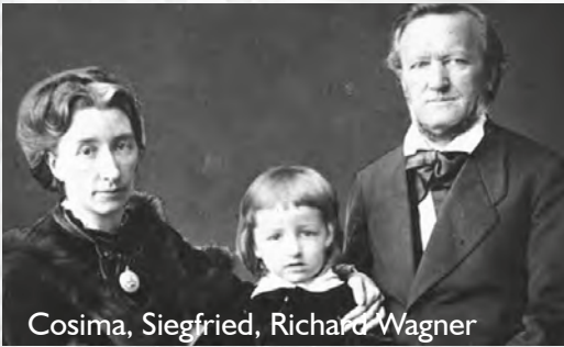
Cosima, Siegfried, Richard Wagner

Richard Wagners liv var i nästan alla tänkbara avseenden stormigt och konfliktfyllt. Detta gällde också hans relationer till kvinnor; äktenskap och otrohet, förälskelser och skandaler följde i hans väg ända fram till 1860-talet, då han blev förälskad i Franz Liszts dotter Cosima (som redan var gift och hade barn med pianisten Hans von Bülow). Hon födde ytterligare tre barn med Wagner som far innan hon kunde skilja sig och göra deras relation officiell. Sonen Siegfried föddes i juni 1869 och ett år senare kunde paret äntligen gifta sig. Wagner ville högtidlighålla detta genom att i hemlighet komponera ett verk till sin nyblivna hustrus ära. Resultatet var Siegfried Idyll för liten orkester, som på hennes födelsedag vid jul 1870 framfördes på verandan till parets villa i Tribschen nära Luzern, som en överraskning, av en grupp musiker ur Zürichs Tonhalle-orkester.